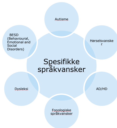
Figur 4.1: Overlapp med andre diagnoser